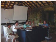
Logotipo original e imagens da reunião do grupo MARUFSC em 2003 na fortaleza da Ilha do Raton