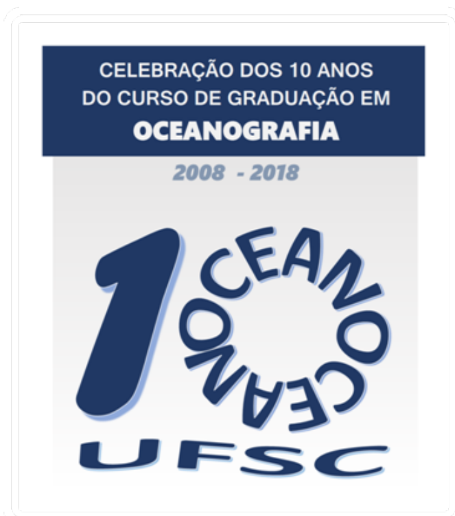
Logotipo oficial das comemorações dos 10 anos do curso de Oceanografia na UFSC