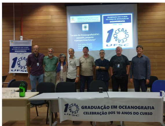
Reencontro, em abril de 2018, da comissão que redigiu o Projeto Pedagógico do curso de Oceanografia.

das redes sociais. Dizia o texto, que acompanhava fotos da primeira turma de formandos: “Brindamos os dez anos do curso de Oceanografia da UFSC desejando uma caminhada repleta de desafios e realizações por muitas outras décadas que ainda estão por vir”. O caminho a trilhar ainda é longo, mas a procura por esses desafios e realizações é a meta do grupo.