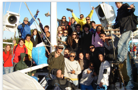
Primeiro embarque realizado pelos alunos do recém-criado curso de Oceanografia