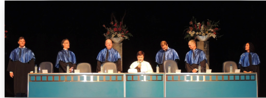
Solenidade de formatura da primeira turma de Oceanógrafos formados na UFSC, em março de 2013.